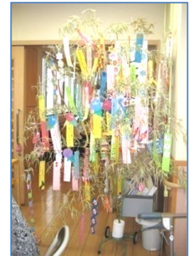
皆で笹の飾り付けをしました。 立派な七夕飾りができました。